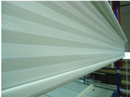
Przykład tkaniny podatnej na zjawisko "przesunięcia"

W związku ze zgłaszanymi przez klientów ANWIS reklamacjami na tkaniny, których wzór w pasy "przemieszcza się", układając w tzw. łuk, zgłosiliśmy problem do producenta tkanin, który w odpowiedzi uzasadnił, iż niemożliwym jest wyeliminowanie tego zjawiska.